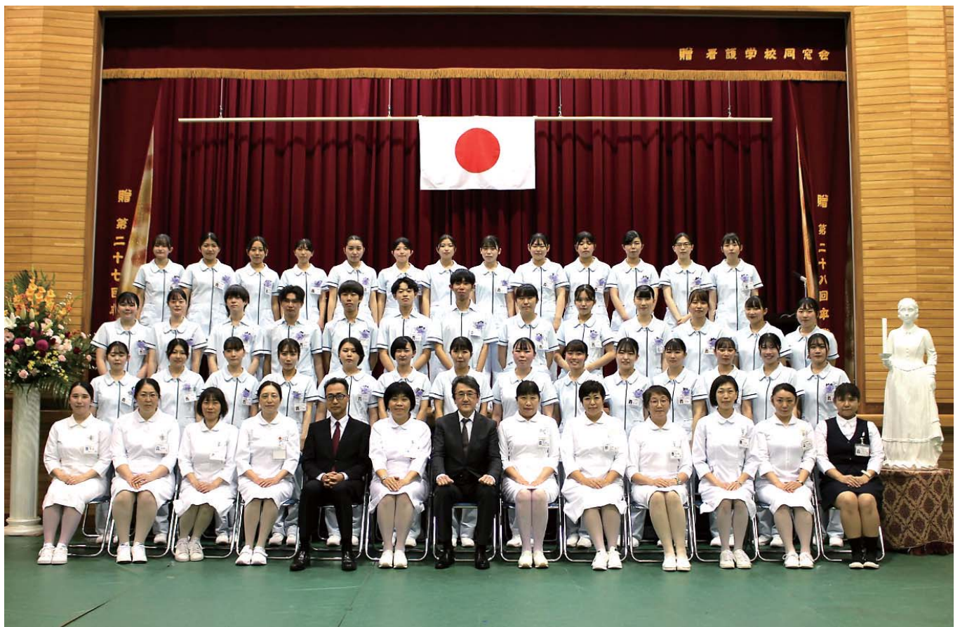
(写真撮影のためマスクを外しています。)