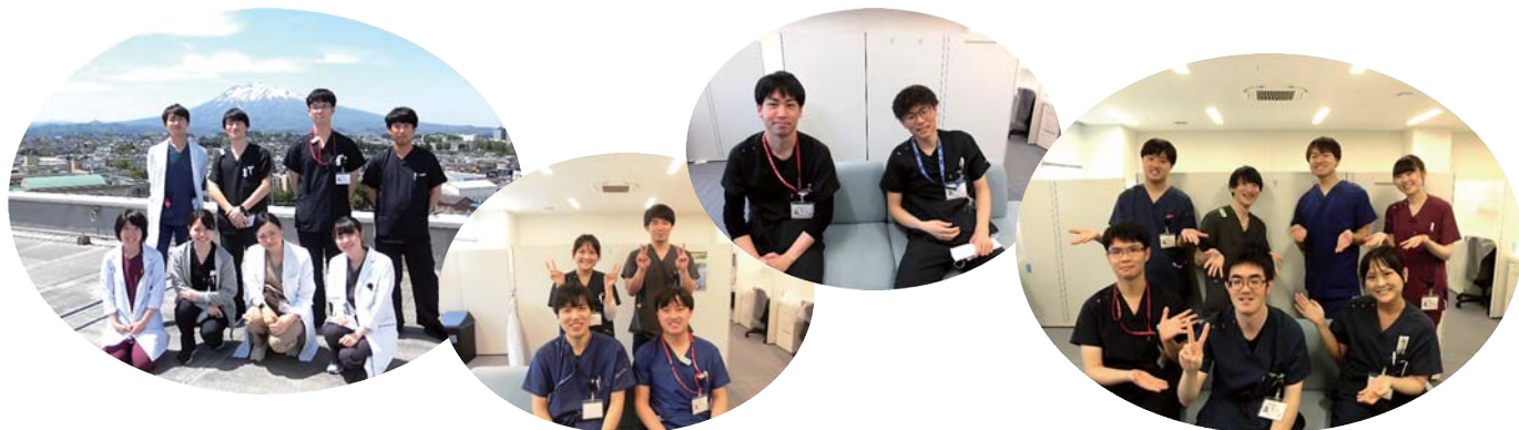
( ※写真撮影のためマスクを外しております )