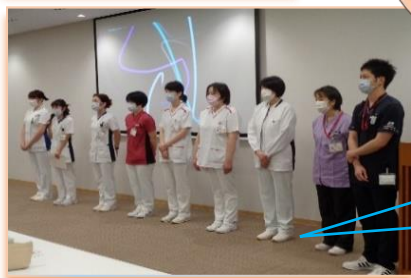
当院のスペシャリスト達です