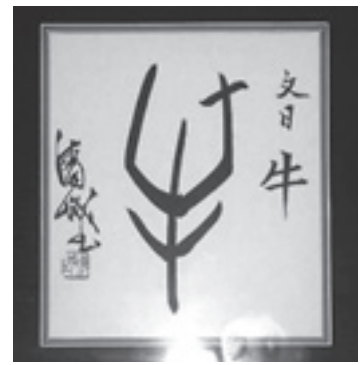
色紙は故山内清城氏から寄贈されたもので一階中央廊下に掲示しています。

ます。 承和十二(845)年 乙丑 ・丑の月・丑の日・丑の刻生まれと伝えられている菅原道真を始め、奈良の大仏建立を命じた聖武天皇、平安遷都の桓武天皇、尼将軍北条政子、江戸時代にあっては蘭学の普及に尽力した杉田玄白、日本地図を完成させた伊能忠敬、そして日本初の総理大臣となった伊藤博文も丑年の生まれです。